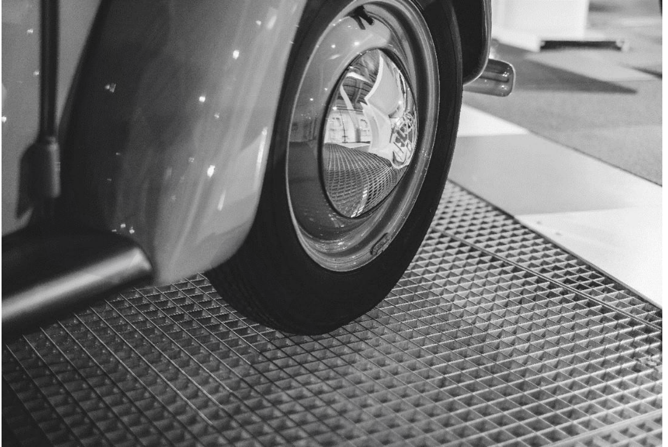
TABLEAU DES CHARGES CAILLEBOTIS PRESSÉS

SPRICH CAILLEBOTIS · ÉCHELLES · ESCALIERS